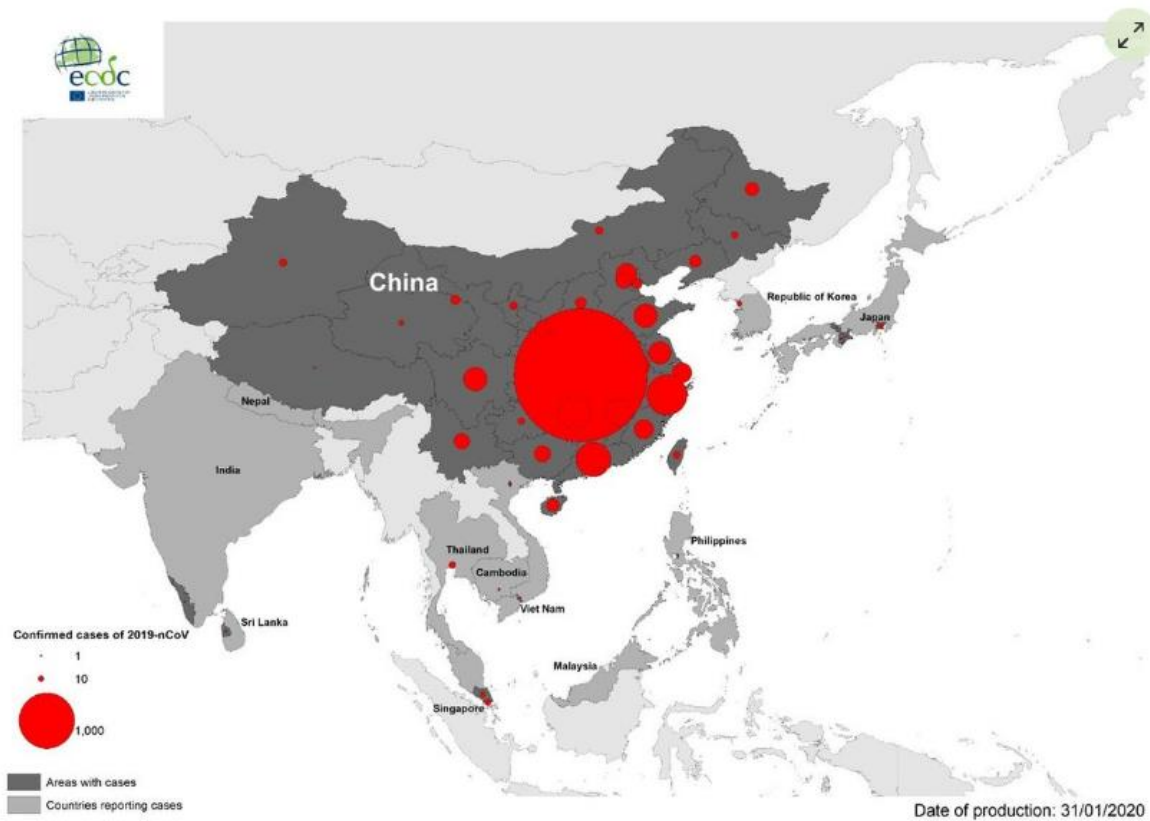
1. ábra: Azon ázsiai országok, területek, ahonnan 2019-NCoV okozta igazolt megbetegedéseket jelentettek (ECDC 2019.01.31)